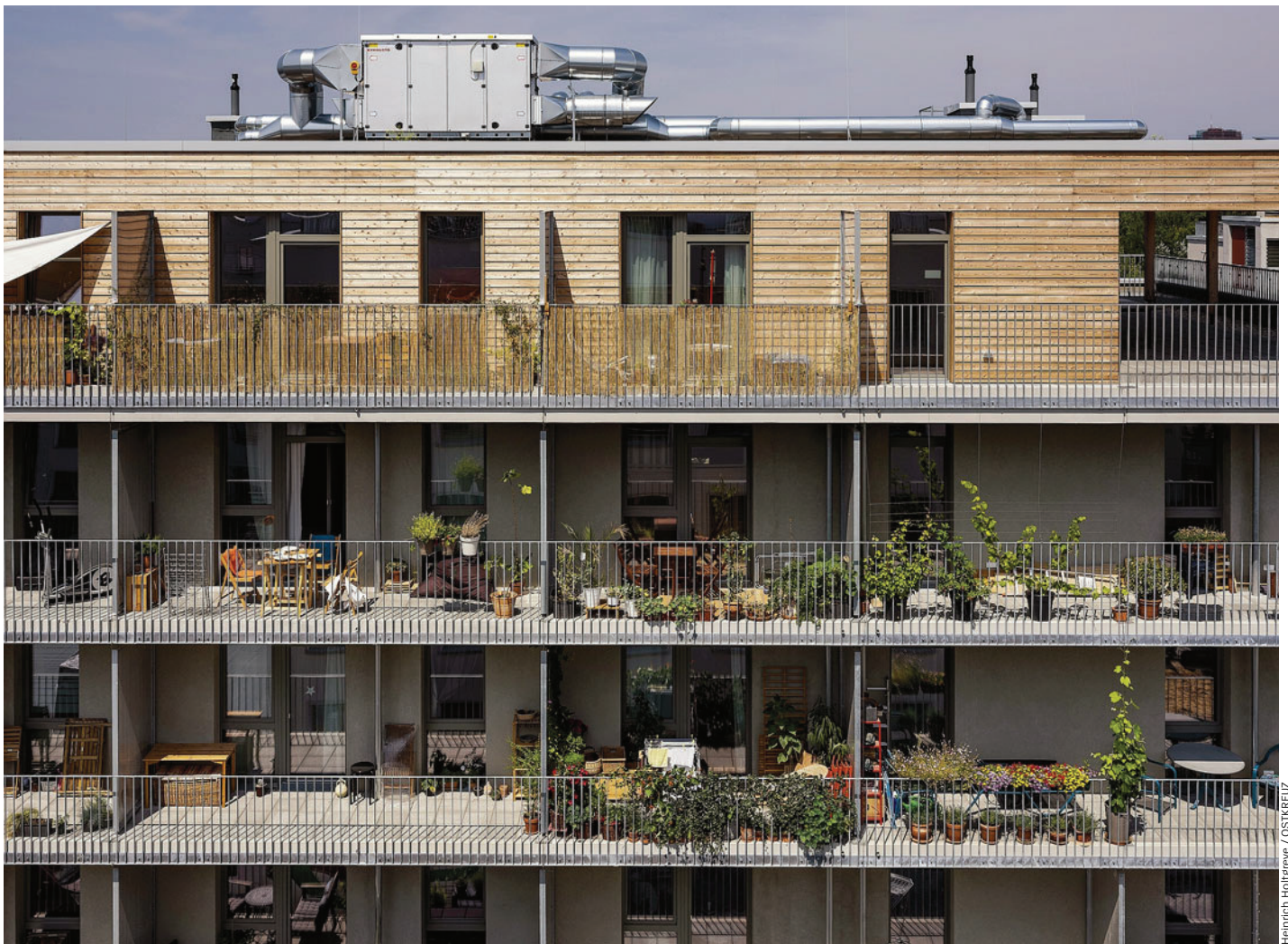
Heinrich Holtgreve / OSTKREUZ